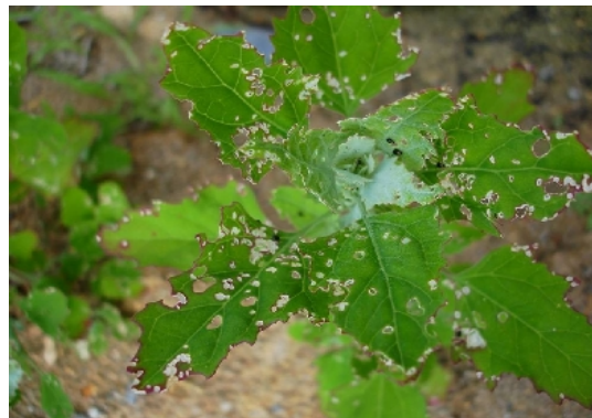
Perforations sur chénopode