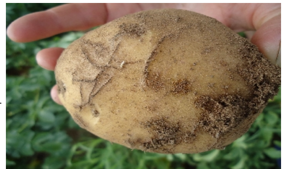
Galeries et larve sur tubercule