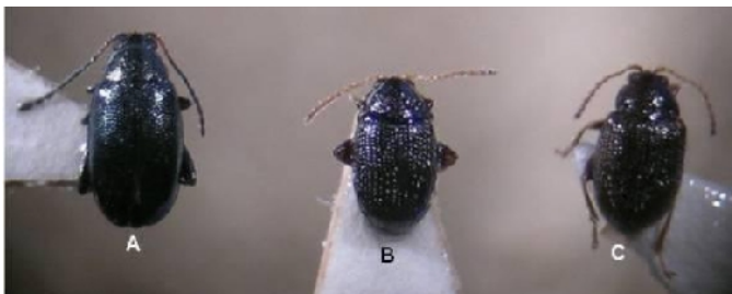
Phyllotreta atra (A), Epitrix similis (B) e Epitrix cucumeris (C)