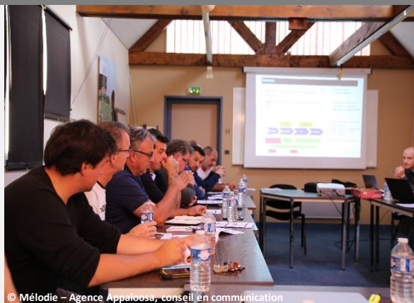
© Mélodie – Agence Appaloosa, conseil en communication