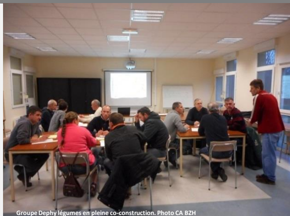
Groupe Dephy légumes en pleine co-construction.